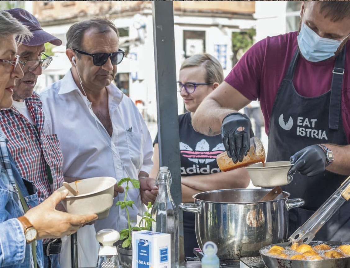
Fotografija s eko-gastro akcije "Hrana nije otpad"